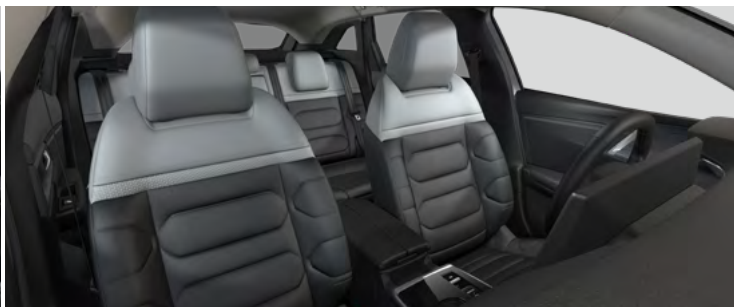
INTERIÉR METROPOLITAN GREY (v sérii pre PLUS)