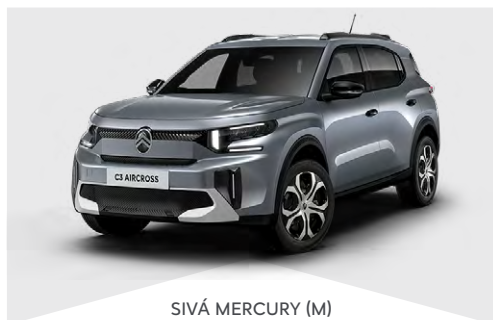
SIVÁ MERCURY (M)