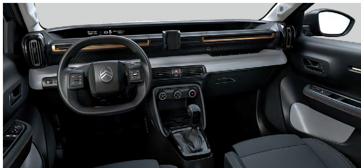
INTERIÉR URBAN BRONZE : LÁTKOVÝ POŤAH ČIERNY (BYFH)