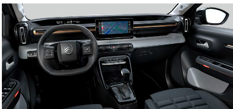
INTERIÉR URBAN BRONZE : LÁTKOVÝ POŤAH ČIERNY (BYFH)