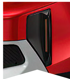
PRE ČERVENÚ ELIXIR