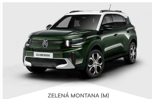
ZELENÁ MONTANA (M)

(M) – metalická farba karosérie, (N) – nemetalická farba