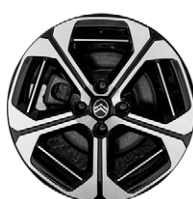
DISK Z LAHKEJ ZLIATINY ARAGONITE 17"