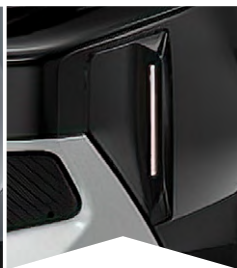
PRE ČIERNU PERLA NERA