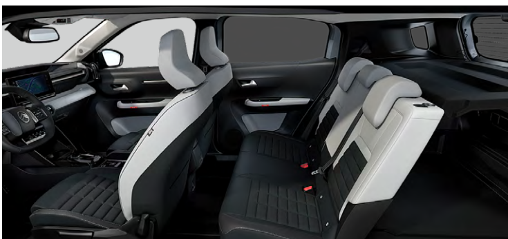
Sedadlá Citroën Advanced Comfort Palubná doska a panely dverí s dekórom Siderite