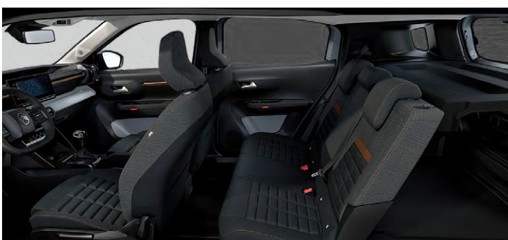
Palubná doska a panely dverí s bronzovým dekórom Sedadlá Advanced Comfort