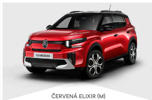
ČERVENÁ ELIXIR (M)