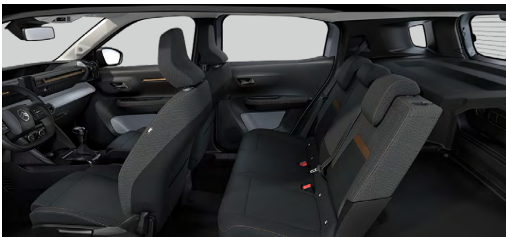
Palubná doska a panely dverí s bronzovým dekórom