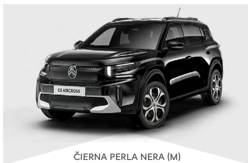
ČIERNÁ PERLA NERA (M)