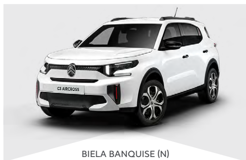
BIELA BANQUISE (N)