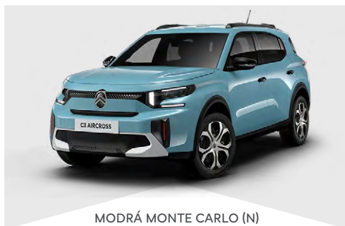
MODRÁ MONTE CARLO (N)