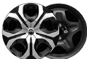
OKRASNÝ KRYT SYLVANITE 17"