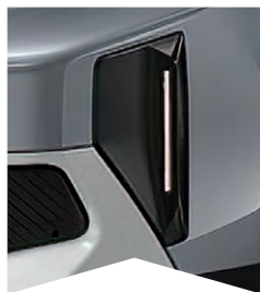
PRE SIVÚ MERCURY