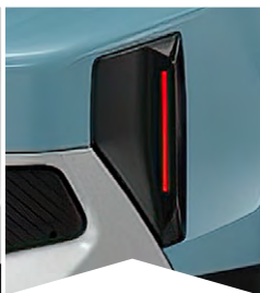
PRE MODRÚ MONTE CARLO