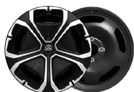
OKRASNÝ KRYT TITANITE 16"