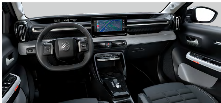
INTERIÉR METROPOLITAN GREY : LÁTKOVÝ POŤAH ČIERNY HELLO / SIVÝ TEP POŤAH (BXFV)