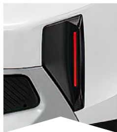
PRE BIELU BANQUISE