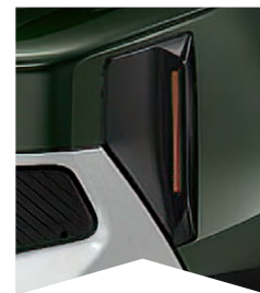
PRE ZELENÚ MONTANA