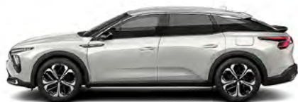
BIELA NACRÉ (P)