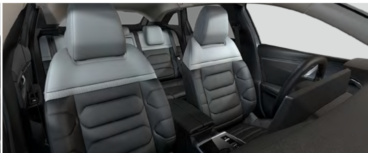
INTERIÉR METROPOLITAN GREY (v sérii pre PLUS)