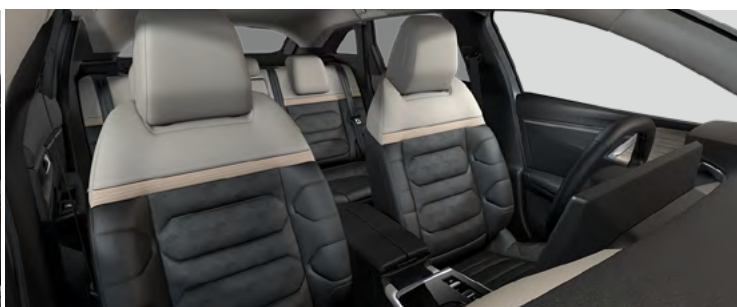
INTERIÉR HYPE ADAMANTIUM