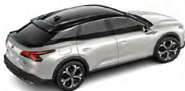
BIELA NACRÉ (P)