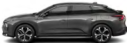
SIVÁ PLATINUM (M)