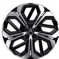
DISK Z LAHKEJ ZLIATINY 19" AERO-X BLACK DIAMOND