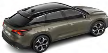
SIVÁ AMAZONITE (M)