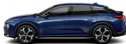
MODRÁ ECLIPSE (M)