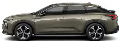
SIVÁ AMAZONITE (M)