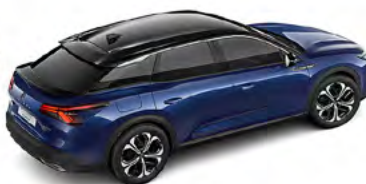
MODRÁ ECLIPSE (M)