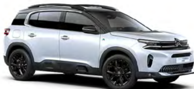
BIELÁ OKENITE (M)