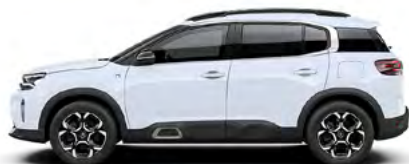
BIELÁ OKENITE (M)