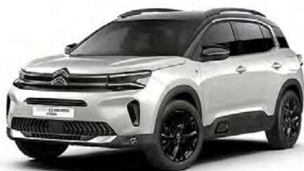
PACK COLOR BLACK