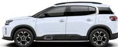
BIELÁ OKENITE (M)