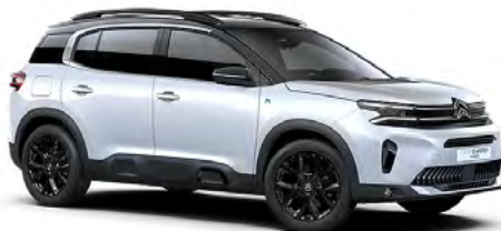
BIELÁ OKENITE (M)