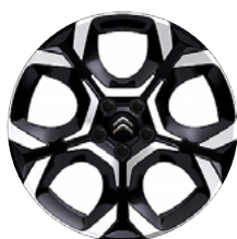
DISK Z LAHKEJ ZLIATINY PULSAR 18"