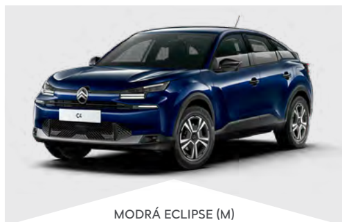
MODRÁ ECLIPSE (M)