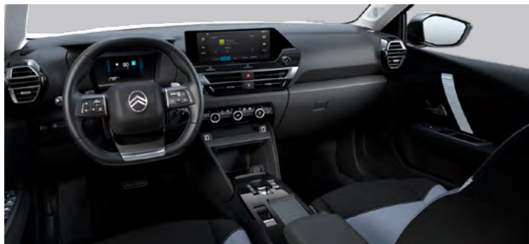
LÁTKOVÉ ČALÚNENIE KOMBINÁCIA SIVÁ/ČIERNA (PRE YOU)