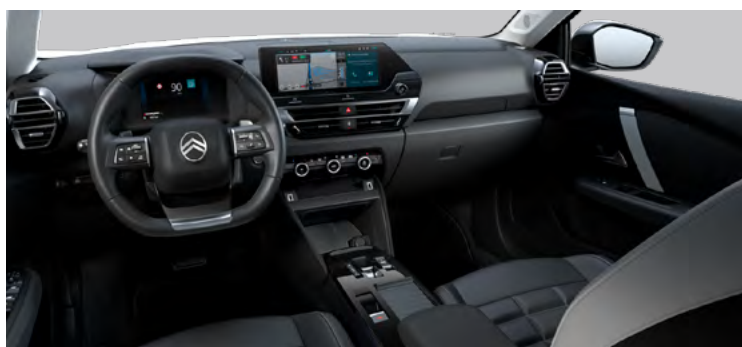
INTERIÉR METROPOLITAN GREY (PRE MAX)

Čierny TEP poťah / sivý TEP poťah — Sedadlá Citroën Advanced Comfort — Odkladacie vrecká na zadnej strane predných sedadiel