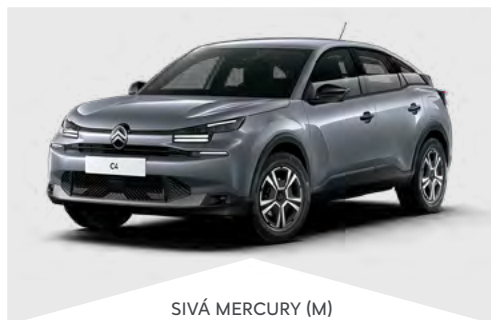
SIVÁ MERCURY (M)