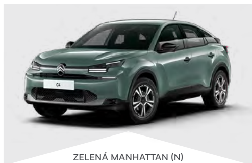
ZELENÁ MANHATTAN (N)