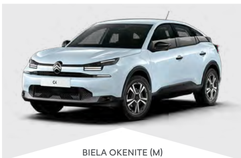
BIELÁ OKENITE (M)