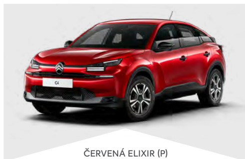
ČERVENÁ ELIXIR (P)

(M) – metalická farba karosérie, (P) – perleťová farba, (N) – nemetalická farba