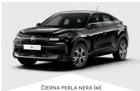
ČIERNÁ PERLA NERA (M)