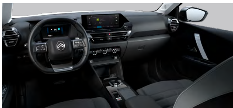
INTERIÉR URBAN GREY (PRE PLUS)

Čalúnenie látka Hello čierna / sivý TEP poťah — Sedadlá Citroën Advanced Comfort — Odkladacie vrecká na zadnej strane predných sedadiel