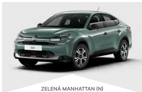
ZELENÁ MANHATTAN (N)