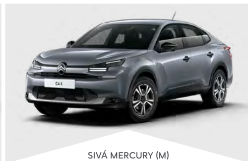
SIVÁ MERCURY (M)