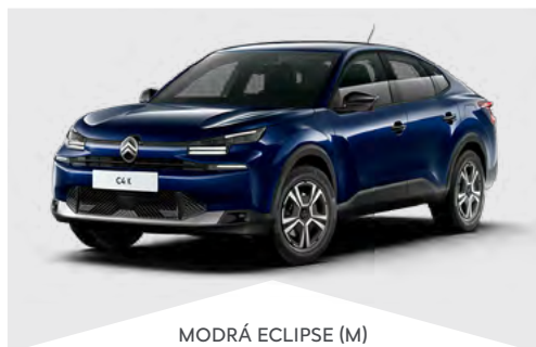
MODRÁ ECLIPSE (M)