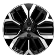
MAX DISK Z LAHKEJ ZLIATINY 18" AMBER