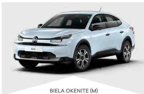
BIELÁ OKENITE (M)