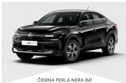
ČIERNÁ PERLA NERA (M)