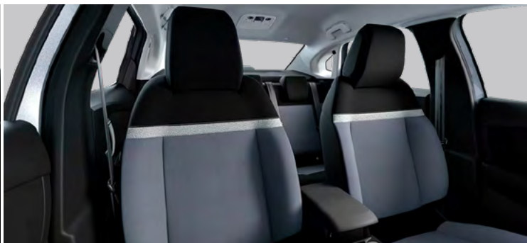
LÁTKOVÉ ČALÚNENIE KOMBINÁCIA SIVÁ/ČIERNA (PRE YOU)