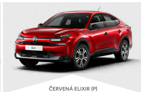
ČERVENÁ ELIXIR (P)

(M) – metalická farba karosérie, (P) – perleťová farba, (N) – nemetalická farba