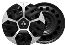
PLUS OKRASNÝ KRYT 18" AEROTECH