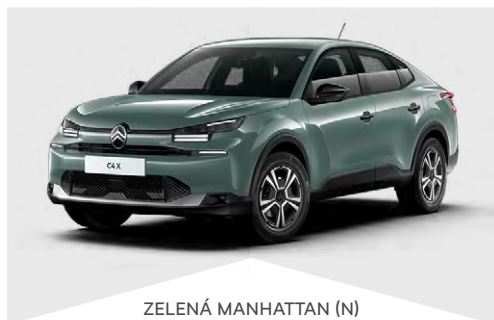
ZELENÁ MANHATTAN (N)