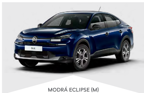
MODRÁ ECLIPSE (M)