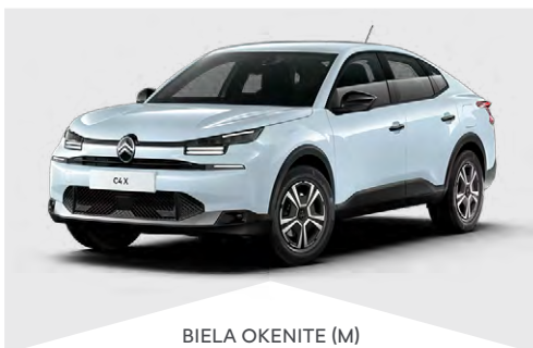
BIELÁ OKENITE (M)