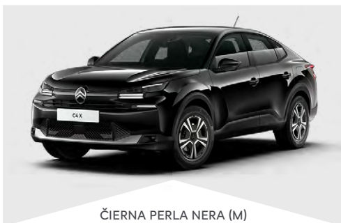
ČIERNÁ PERLA NERA (M)