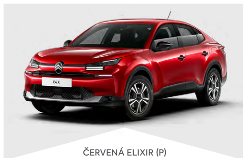
ČERVENÁ ELIXIR (P)

(M) – metalická farba karosérie, (P) – perleťová farba, (N) – nemetalická farba