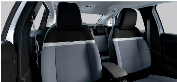
LÁTKOVÉ ČALÚNENIE KOMBINÁCIA SIVÁ/ČIERNA (PRE YOU)