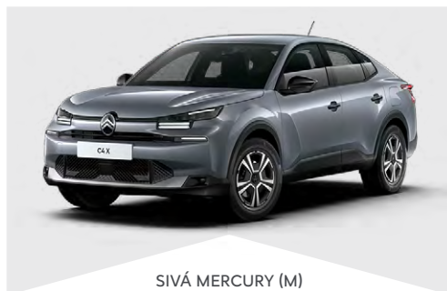
SIVÁ MERCURY (M)