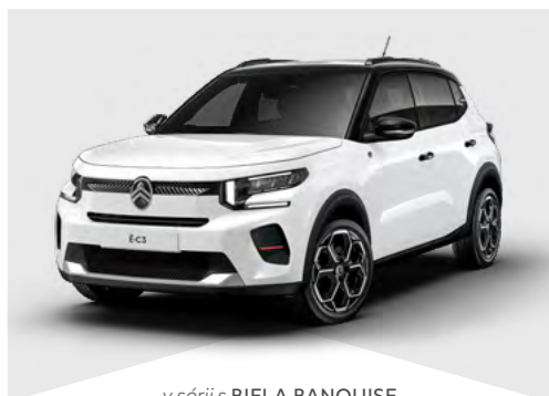
v sérii s BIELA BANQUISE