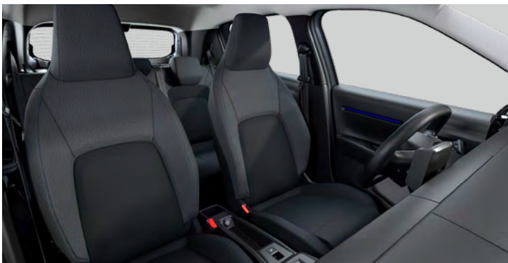
Integrované predné opierky hlavy Palubná doska a panely dverí s modrým dekórom