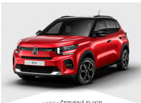
v sérii s ČERVENÁ ELIXIR