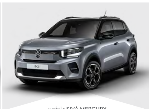
v sérii s SIVÁ MERCURY