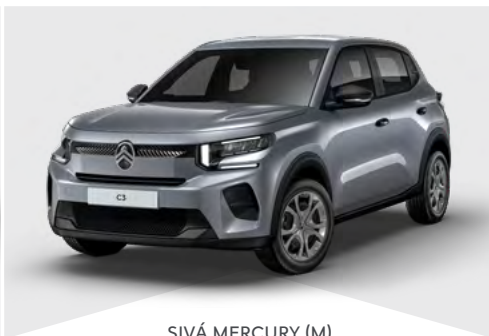
SIVÁ MERCURY (M)