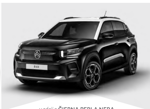
v sérii s ČIERNÁ PERLA NERA

Je možné zvoliť aj jednofarebnú karosériu (okrem modrá MONTE CARLO).