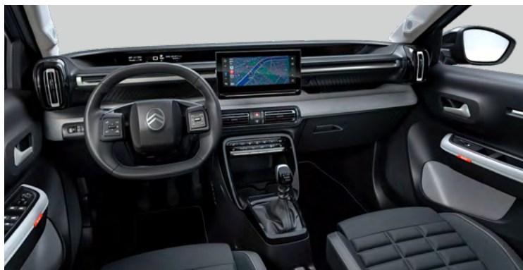
INTERIÉR METROPOLITAN GREY (NHFX)