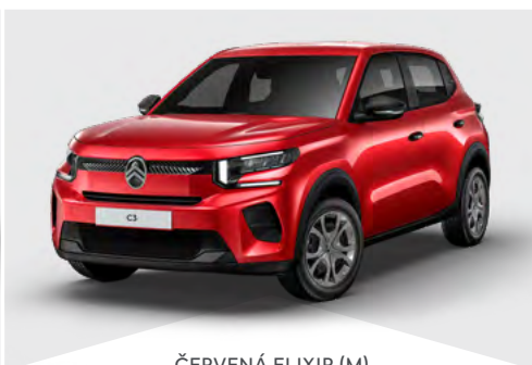
ČERVENÁ ELIXIR (M)

(M) – metalická farba karosérie (N) – nemetalická farba