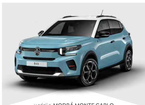
v sérii s MODRÁ MONTE CARLO