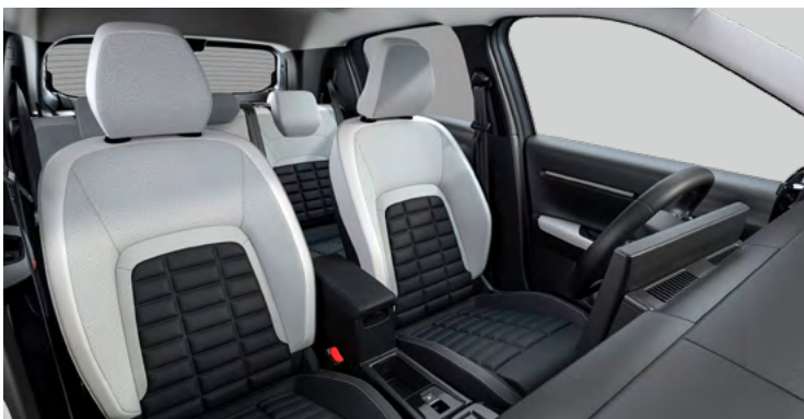
Látkový poťah čierny Fabric / sivý TEP poťah Sedadlá Citroën Advanced Comfort Palubná doska a panely dverí s dekórom Siderite