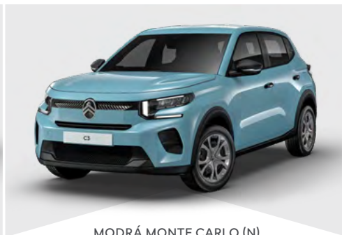
MODRÁ MONTE CARLO (N)