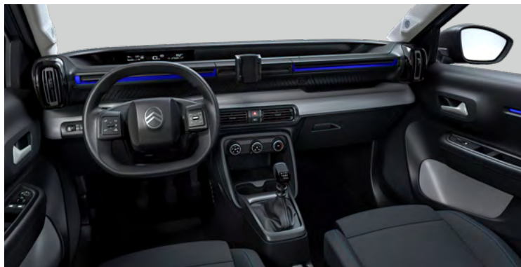
LÁTKOVÝ POŤAH ČIERNOSIVÝ (NAFX)