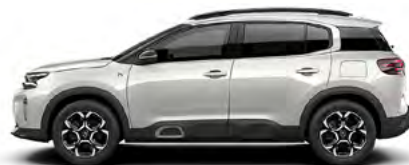
BIELA NACRÉ (P) (1)