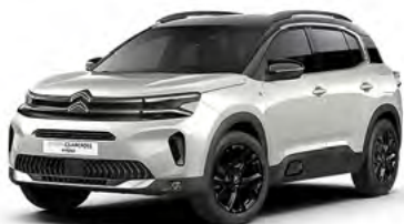
PACK COLOR BLACK