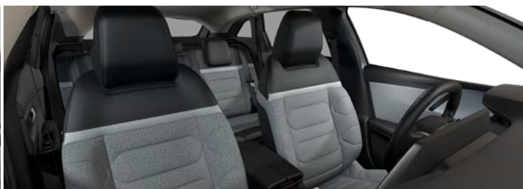
INTERIÉR URBAN GREY (v sérii pre Feel Pack)