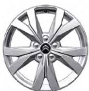
DISK Z ĽAHKEJ ZLIATINY 17" VORTE-X