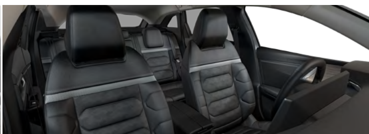
INTERIÉR HYPE BLACK (v sérii pre Shine Pack)