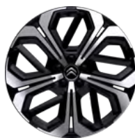
DISK Z ĽAHKEJ ZLIATINY 19" AERO-X BLACK DIAMOND