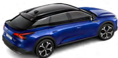
MODRÁ MAGNETIC (M)