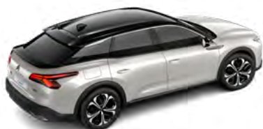
BIELÁ NACRÉ (P)