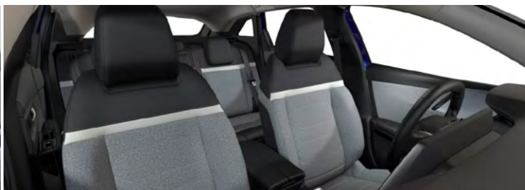
ŠTANDARDNÝ INTERIÉR LÁTKA CHEVRONS SIVÁ/LÁTKA ČIERNA (v sérii pre Feel)