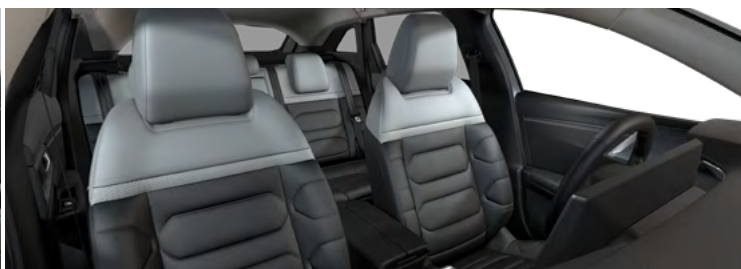
INTERIÉR METROPOLITAN GREY (v sérii pre Shine)